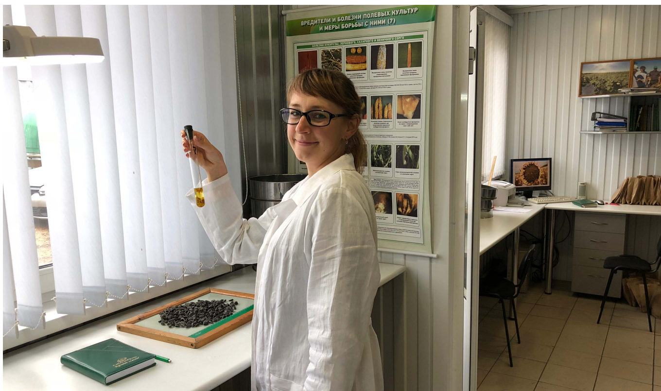
Селекционно-семеноводческая компания ООО «СибАгроЦентр»