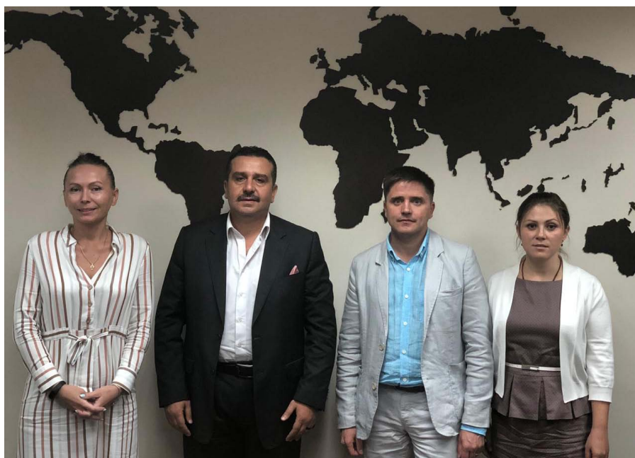
ООО «Сохрани зерно» на деловой встрече