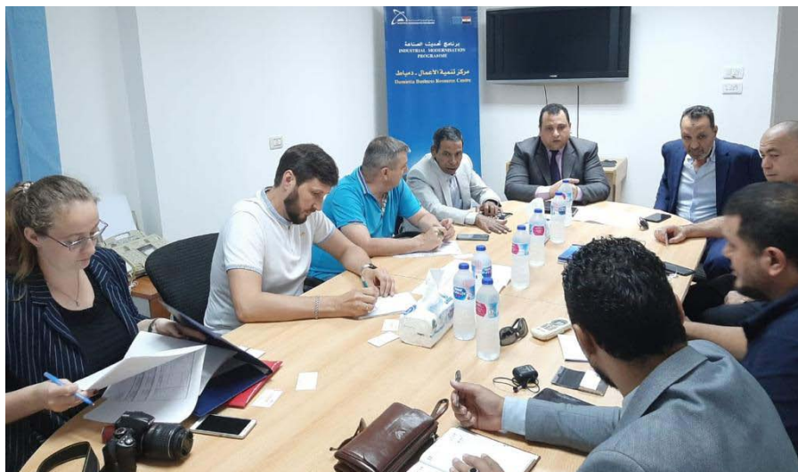
Представители SOKOLOVOLES на деловой встрече